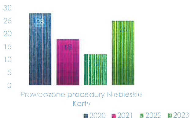
Wykres 1 Liczba procedur NK prowadzona w okresie 2020 - 2023 w Gminie Załuski