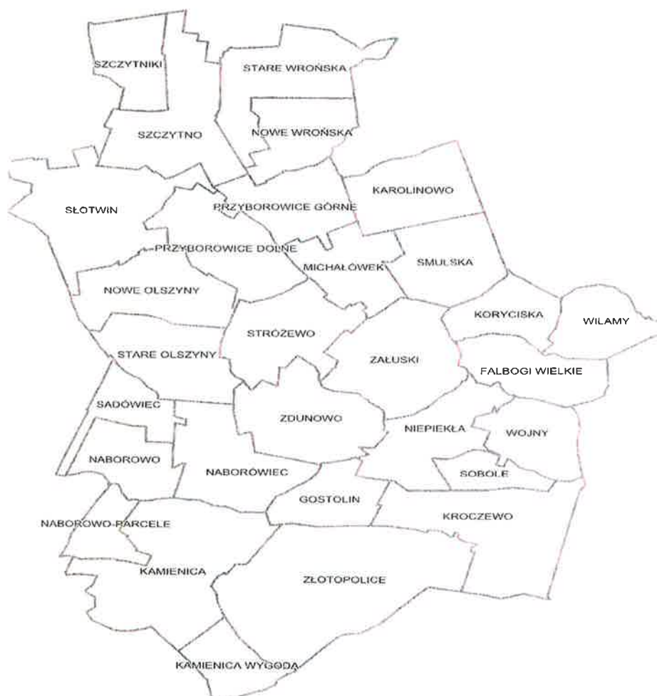
Rysunek 1 Mapa sołectw Gminy Załuski

W skład gminy Załuski wchodzi 30 sołectw: